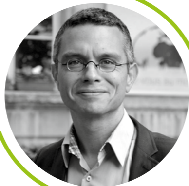
Roxane Science Po Lyon

« Les MOOCs que propose le CHEL[s] témoignent de son esprit : croiser les approches des arts et des différentes sciences (des sciences humaines et sociales aux sciences du vivant) pour mieux saisir et rendre intelligibles les enjeux du monde contemporain. Les MOOCs sont des fenêtres qui nous permettent de partager avec le plus grand nombre notre plaisir à réfléchir sur la décision, les risques ou encore le progrès. »