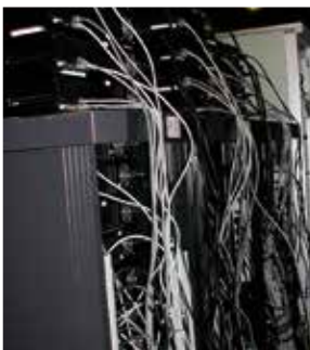
Grille de calcul, côté connectique

Chaque étudiant bénéficie d'un encadrement personnalisé par un enseignant tuteur, d'une formation approfondie à l'anglais scientifique et assiste à de nombreux séminaires scientifiques.