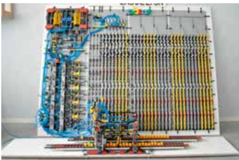
Machine de Turing en légo - Projet étudiant