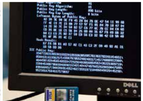
Extraction de données cryptographiques d'une carte bancaire