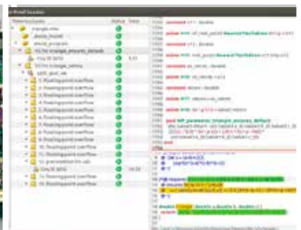
Preuve de programme