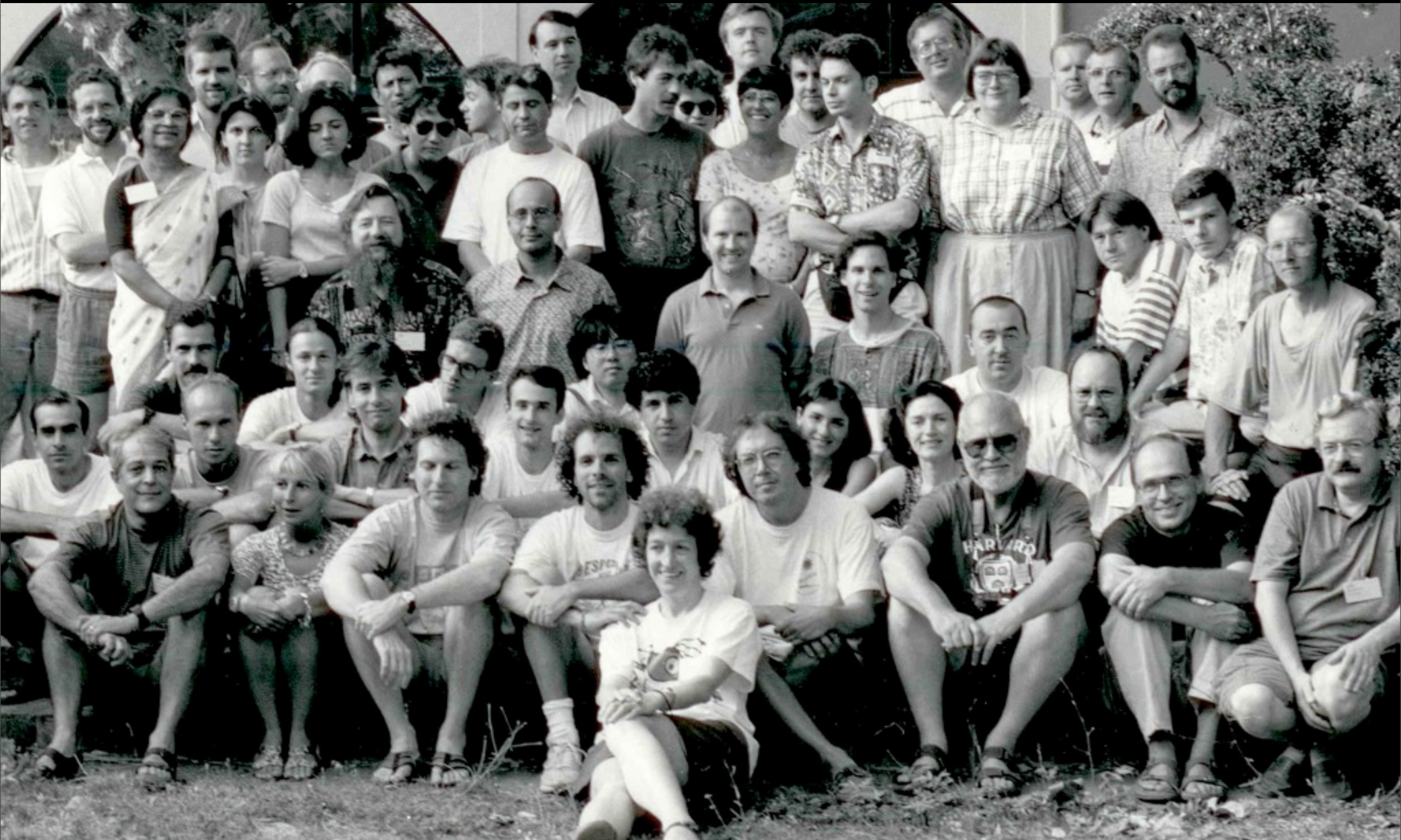
Wednesday, May 30, 2012