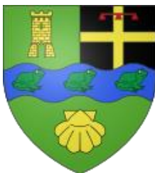
Mairie de Ouches