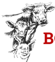
BOUCHERIE SEON VIAL