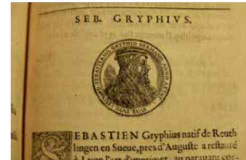
Du Verdier, Prosopographie , Lyon, 1573