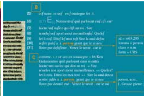
Base de Français Médiéval (UMR ICAR)