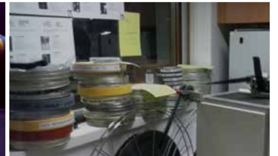
Cabine de projection du théâtre Kantor