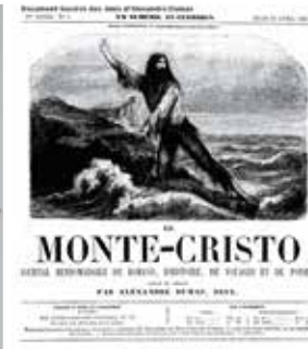
Alexandre Dumas, 1857