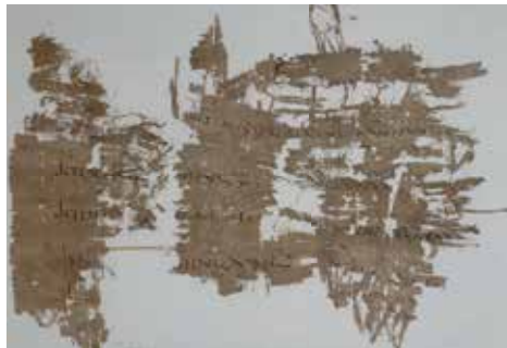
Fragment de C. Gallus (papyrus)