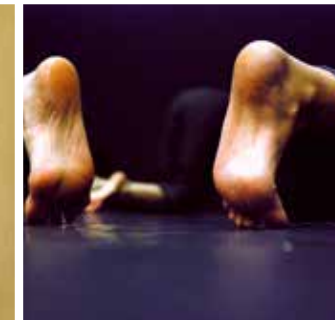
Master class Danse