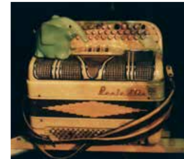
Master class Théâtre musical

Voir tout le programme sur l'agenda de l'ENS de Lyon