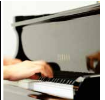
Concert de midi