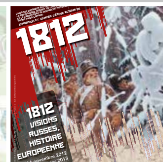
Journée d'études sur 1812, la campagne de Russie