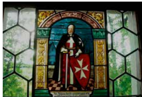
Commanderie de Bubikon