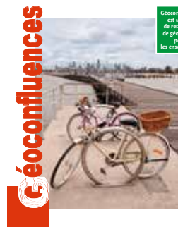
Site de ressources Géoconfluences

Géoconfluences est un site de ressources de géographie pour les enseignants.