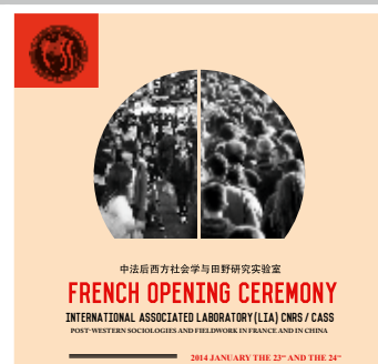
Laboratoire international associé de sociologie, France/Chine