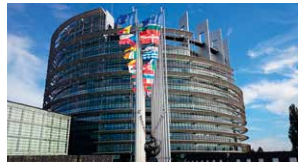
Parlement européen de Strasbourg

Géoconfluences est un site de ressources de géographie pour les enseignants.