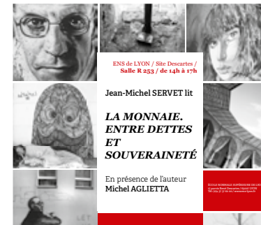
Analyse économique et politique