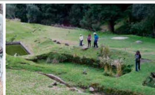
Voyages d'études, Mexique