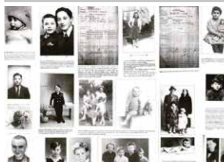
Exposition sur la déportation des enfants juifs de Paris