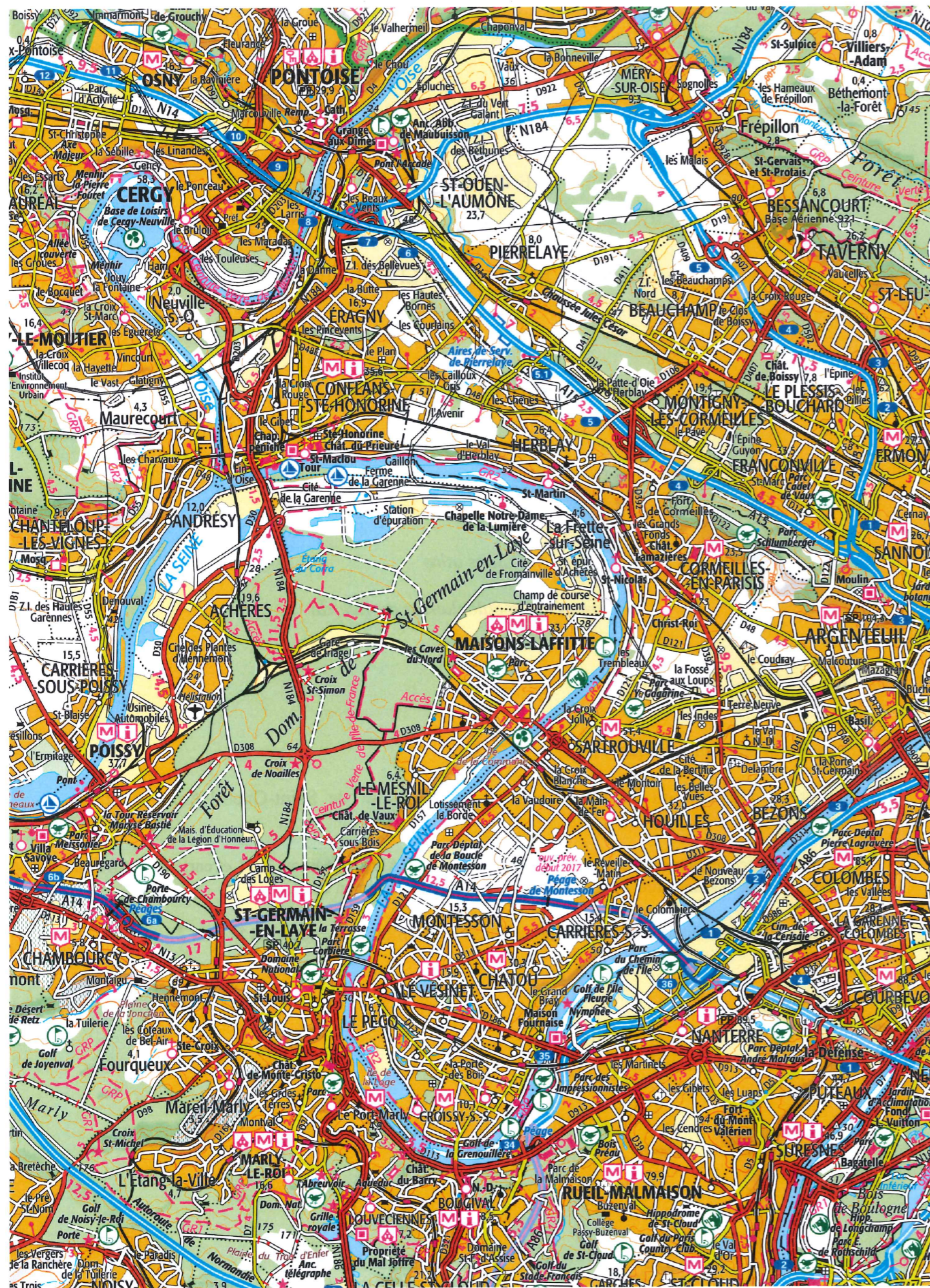
Extrait du SCAN 100 édition 2011 (échelle au 1/100 000)