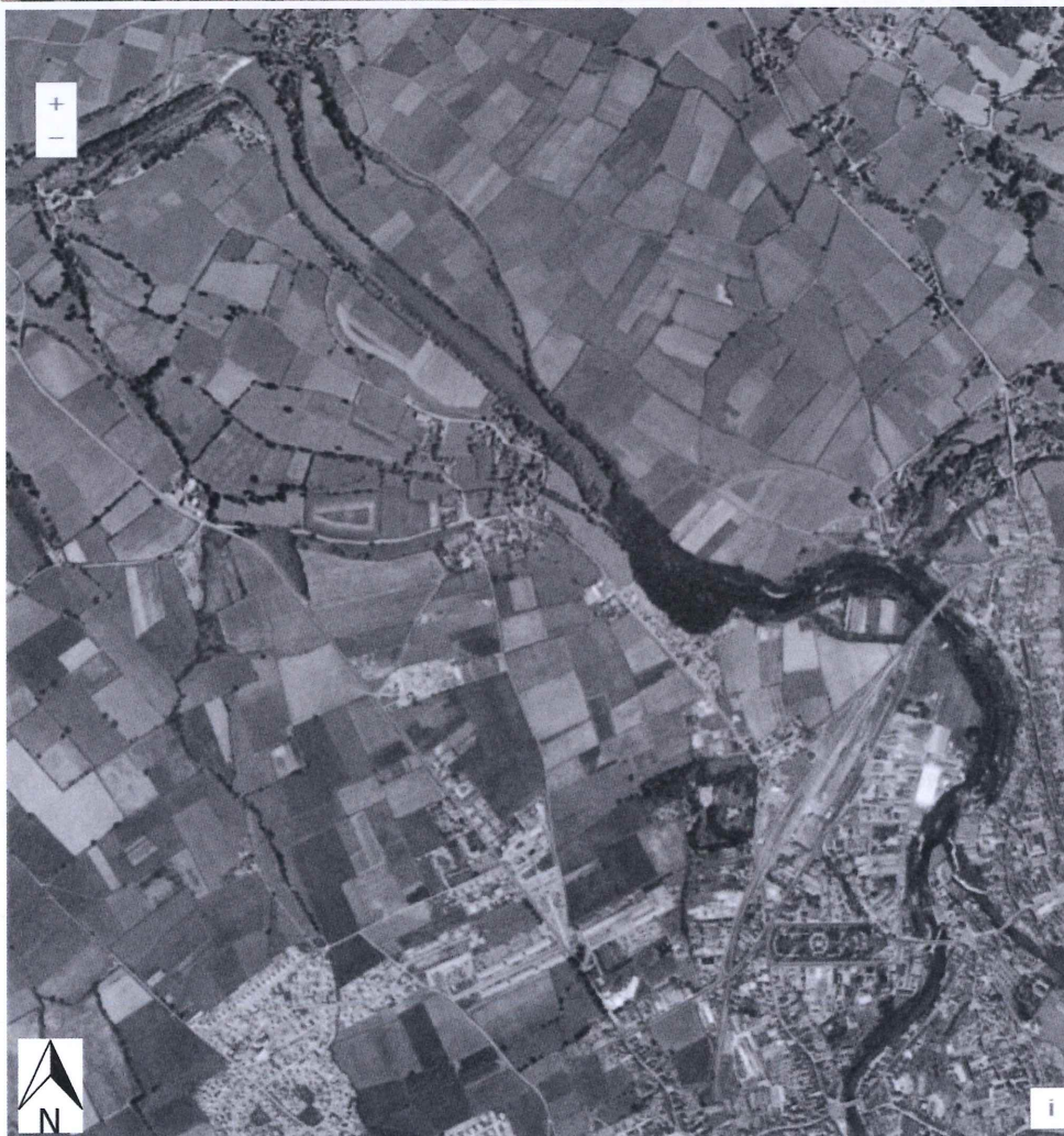
Photographies aériennes prises en 1959 (en bas) et en 2018 (en haut)