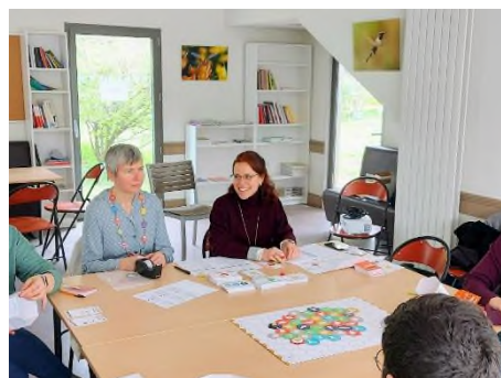
Session de jeu « Sexisme sans façon »