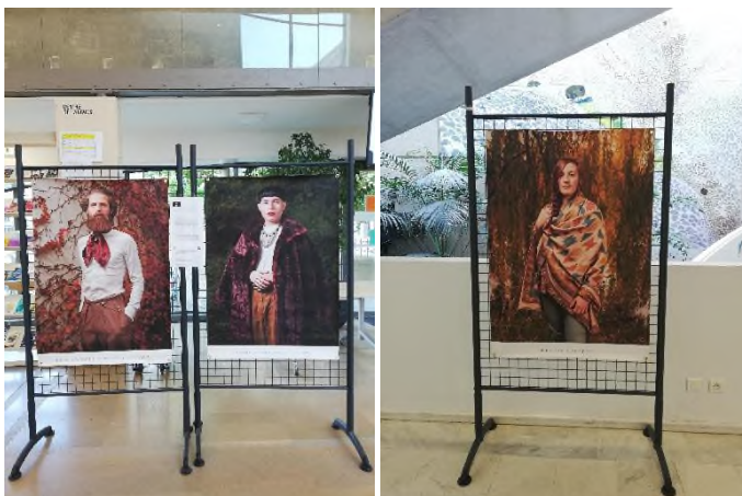
Des panneaux de l'exposition Queer à Descartes et à Monod